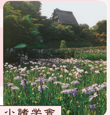
花の菖蒲沢 花菖蒲祭